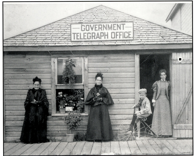
Les bureaux de la télégraphie à Fort Qu'Appelle vers 1896.

La télévision est arrivée en Saskatchewan en 1954 avec l'ouverture des stations de Regina et de Saskatoon. La télévision offrait tout un divertissement à la famille. Malheureusement, les Francophones, venant tout juste de se donner deux postes de radio en 1952, ont dû attendre jusqu'en 1976 avant d'obtenir une station de télévision en français.