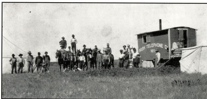
Une équipe de la Saskatchewan Telephone Company en 1909.

Quels problèmes pourraient se développer avec une telle communication? Y a-t-il des aspects positifs et négatifs ?