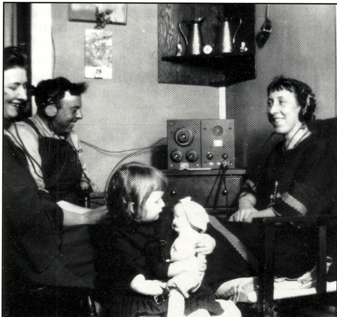
Une famille de Bateman devant un récepteur de radio vers 1930.

En groupe de quatre ou cinq, écrivez (et enregistrez, si possible) une émission d'affaires publiques pour la radio ou la télévision.