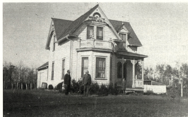
La maison du médecin Touchet à Duck Lake.