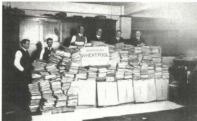
Les fermiers ont organisé le Wheat Pool.

http://www.sasked.gov.sk.ca/docs/francais/fransk/schumaines/6e/u4/instact3.html