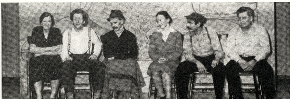
« Paper Wheat The Book », 25th Street Theatre , Western Producer Prairie Books , Saskatoon, 1982 p.74

Paper Wheat , une pièce de théâtre produite par 25th Street Theatre de Saskatoon au début des années 1970, racontait l'histoire du Wheat Pool. La pièce a connu un grand succès au Canada; 65 000 personnes ont vu cette pièce dans 80 différentes communautés.