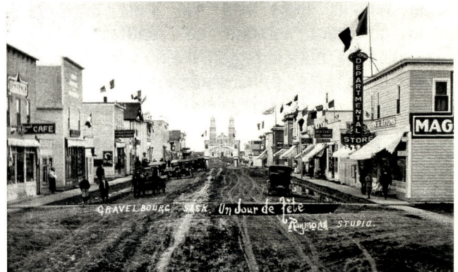
La rue principale de Gravelbourg en 1925.

Durant les années 1950, le gouvernement CCF de Tommy Douglas a mené une étude sur le fonctionnement des municipalités rurales. La conclusion de cette étude était que le système des municipalités rurales devrait être aboli et remplacé par un système de quelque 60 comtés. L'étude a été mise de côté, tout comme une deuxième étude menée à la fin des années 1990 qui en venait à la même conclusion.